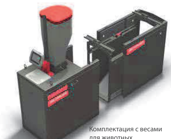
Комплектация с весами для животных